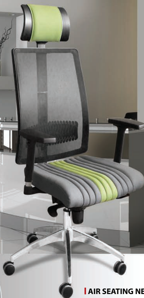
AIR SEATING NET