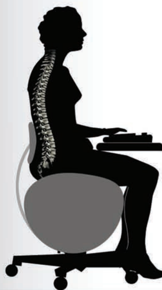
správné držení těla při sezení na balonové židli