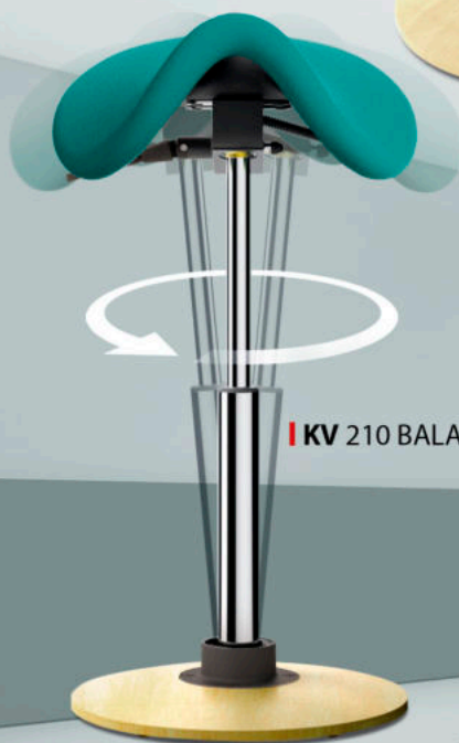
KV 210 BALANČNÍ