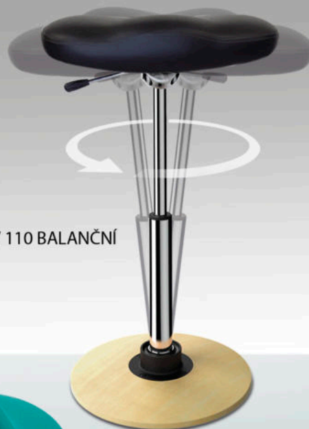
KV 110 BALANČNÍ