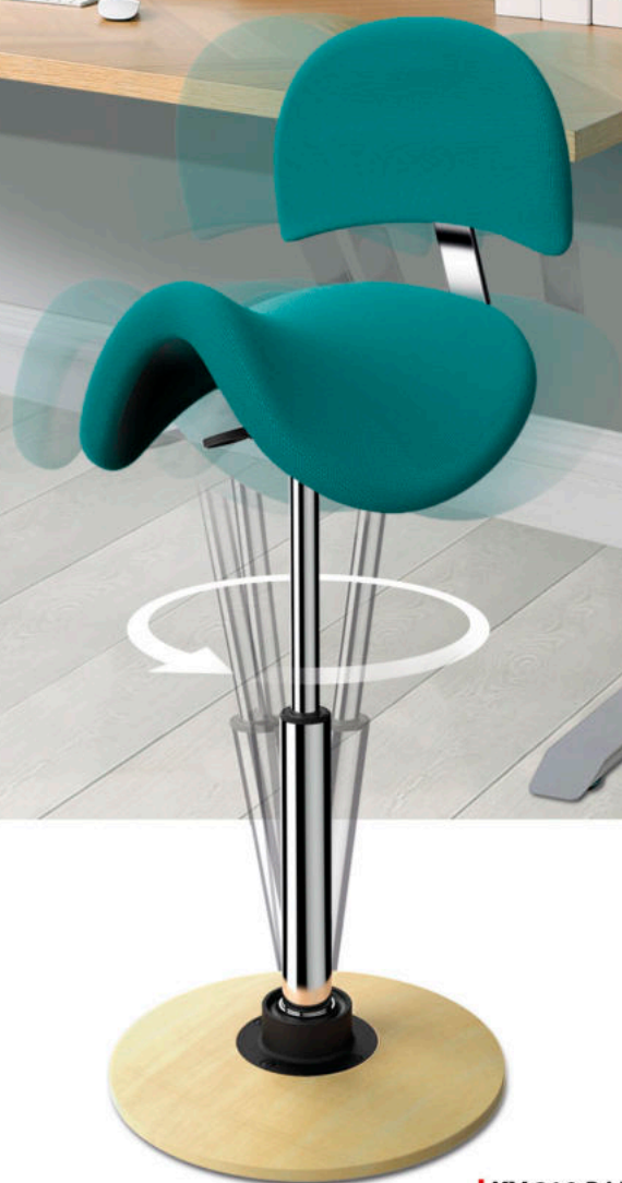
KV 310 BALANČNÍ