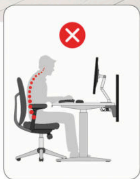
nesprávné držení těla při sezení způsobuje bolesti v zádech