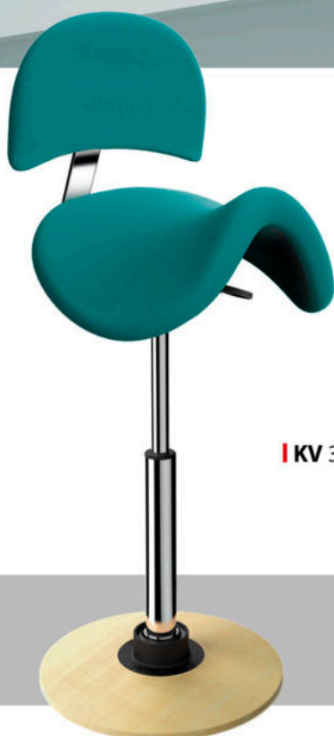
KV 300 PEVNÁ