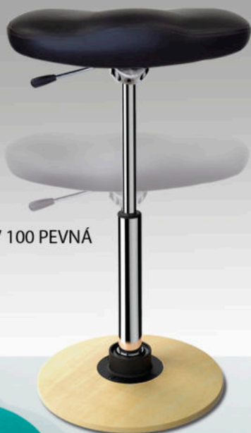
KV 100 PEVNÁ